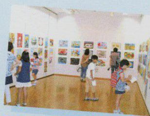
児童絵画・アドバンス